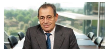
Víctor Grifols Roura