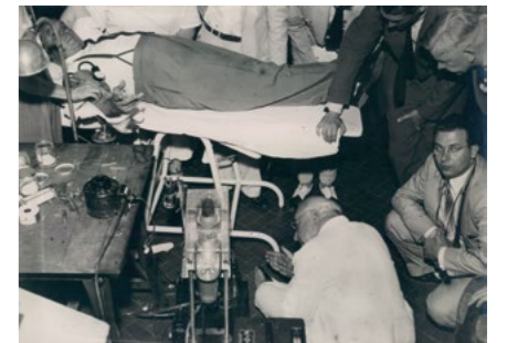
JOSEP ANTONI GRÍFOLS I LUCAS Y EDWIN J. COHN EN EL 4TH INTERNATIONAL BLOOD TRANSFUSION CONGRESS EN PORTUGAL EL 1951.

A lo largo de los últimos 115 años y con el compromiso inquebrantable de cuatro generaciones de la familia Grifols, la compañía ha trabajado con la misión de generar impacto social positivo para crear una sociedad mejor. Este legado ha dado forma a lo que somos hoy y a cómo seguimos trabajando para llevar nuestros medicamentos a más pacientes en más partes del mundo.